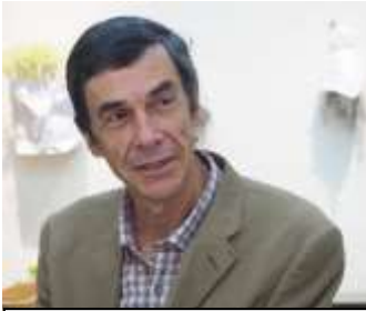
グロッセ・リュック (パザリスト/ピカデナ) 自然を活かした庭づくり

エコールグロッセは…“みどりのゆび”を育てる自然の学校。自然から学び、自己を開花させる表現と創造の学び場 自然界をよく観察していると、あらゆるレベルに振動とリズムの形跡が刻まれています。葉っぱの周りのギザギザは、その葉っぱ固有の符号とリズムそのもの。芸術と自然科学と哲学の融合のように様々な流れを統一し、融合させる時代が来たのではないかとされます