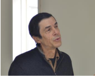
グロッセ・リュック (パザリスト/ピカデナ) 自然を活かした庭づくり

エコールグロッセは…“みどりのゆび”を育てる自然の学校。自然から学び、自己を開花させる表現と創造の学び場 自然界をよく観察していると、あらゆるレベルに振動とリズムの形跡が刻まれています。葉っぱの周りのギザギザは、その葉っぱ固有の符号とリズムそのもの。芸術と自然科学と哲学の融合のように様々な流れを統一し、融合させる時代が来たのではないかとされます